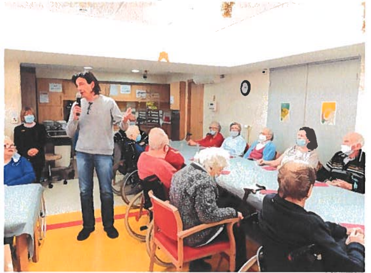
Les présidents du C.V.S. et de l'association ' Les Amis de la Clairie ' étaient conviés à ce moment festif.