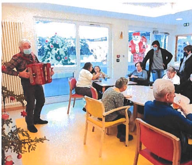
Accordéon à l'U.V.P.