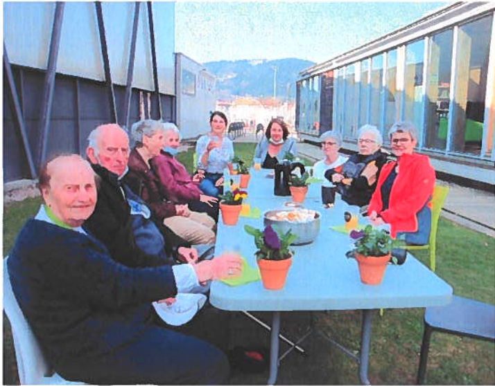
21 AVRIL QUIZ Un après- midi de détente avec

des questions de culture générale sur la faune et la flore.